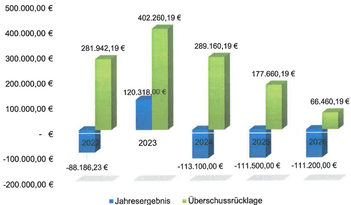
Jahresergebnisse und Überschussrücklagen mit Prognose

Wie sich die Überschussrücklagen unter Einbeziehung der Daten aus der Ergebnisplanung in den kommenden Jahren voraussichtlich entwickeln werden, wird aus der nachfolgenden Übersicht und dem dazugehörigen Diagramm deutlich.